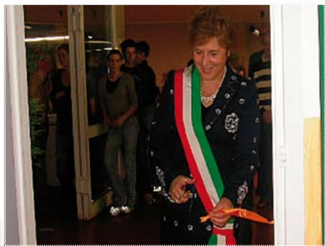
Il taglio del nastro da parte del sindaco

L’inserimento iniziale proposto a settembre è stato pensato per garantire ai bimbi un approccio graduale e sereno, e sembra che l’obiettivo sia stato raggiunto, dal momento che, come affermano le stesse educatrici,